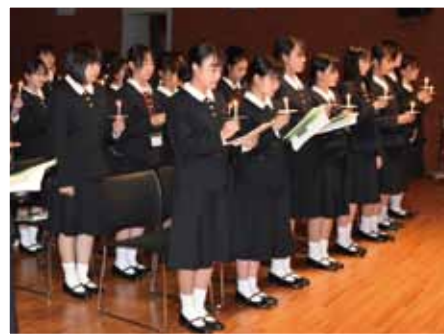
■ 新入生オリエンテーション合宿