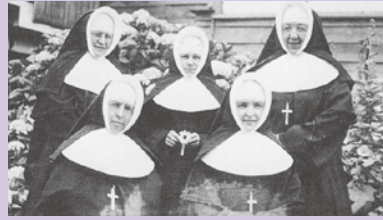
*写真 カナダから最初に来日された5人のシスター方(1934年)