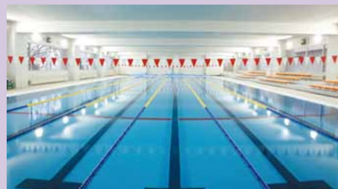
■ 第2体育館 1階に温水プール (25メートル×6レーン)、2階にメインアリーナ、3階にサブアリーナがあります。

大学・大学校等進学 141名 (文系73名、理系63名、その他5名) 未定28名 現役進学率 83.4%