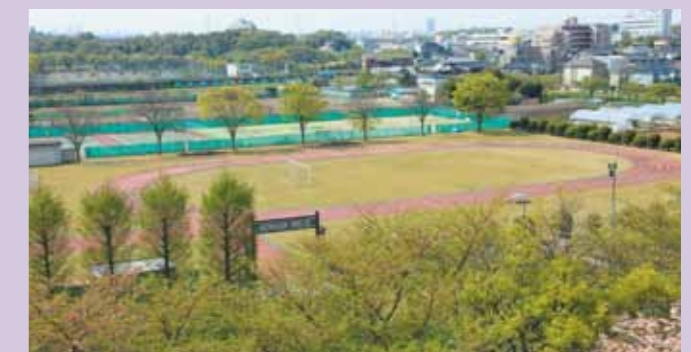
■ 運動場 200メートルトラック、テニスコート (砂入り人工芝4面)、テニス・バスケット兼用コート (ハード2面) を備えています。