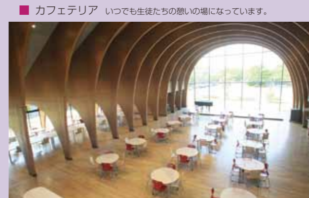
■ カフェテリア いつでも生徒たちの憩いの場になっています。