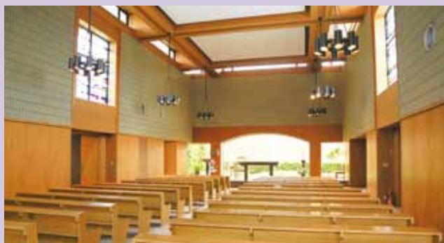
■ チャペル 鐘樓の三つの鐘には、FIDES(信仰)、SPES(希望)、CARITAS(愛)の文字が刻まれています。