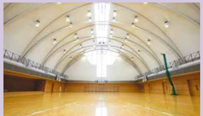
■ 第1体育館 体育の授業の他、行事や部活動が行われます。