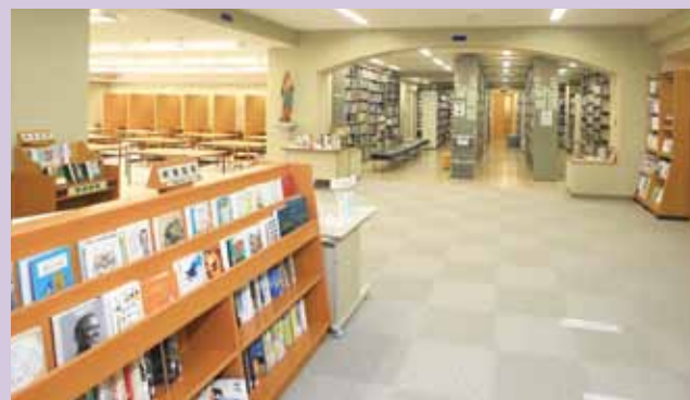
■ 図書館 中学・高校共用で、約10万冊の蔵書があります。