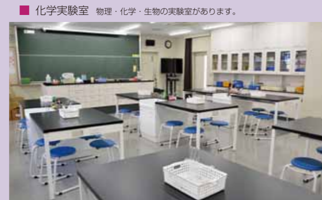
■ 化学実験室 物理・化学・生物の実験室があります。